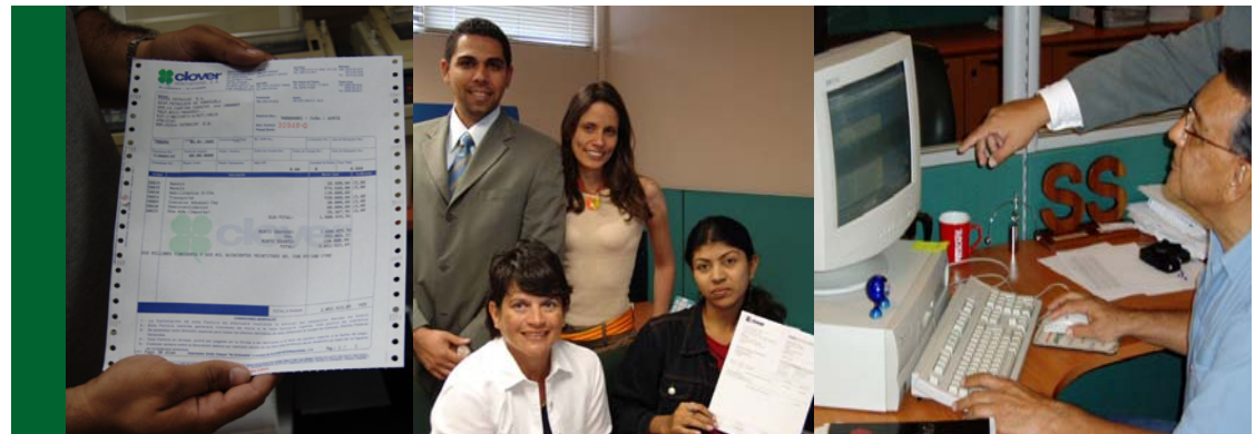
La primera factura emitida por el sistema.