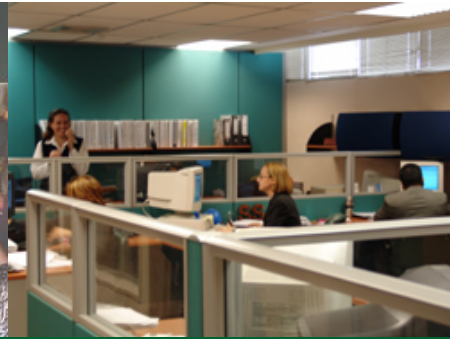
Centro de Soporte del Outsourcing