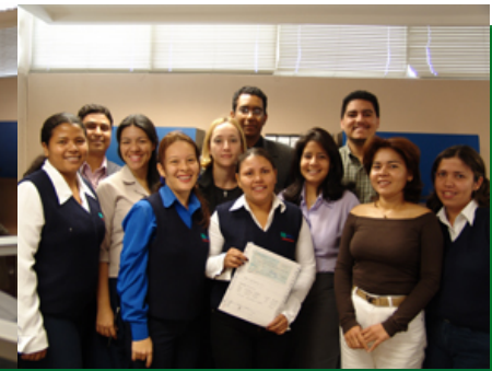
Parte de los usuarios claves al emitir el primer reporte de Contabilidad.

El Éxito: del proyecto se debió a que siempre se trabajó en conjunto con un equipo de Gestión del Cambio, el cual tuvo como premisas: