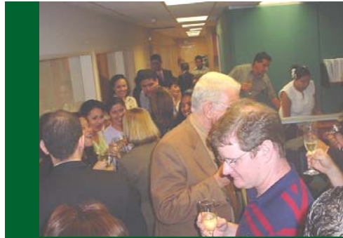
El festejo el día del arranque, el equipo del proyecto con la directiva de la empresa Clover.