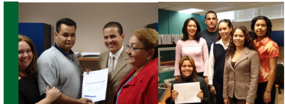
Primer pedido de Ventas obtenido en el arranque.