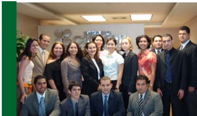
Integrantes del equipo de SofOS en el Proyecto Trebol